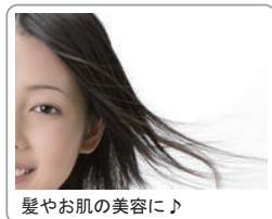
髪やお肌の美容に♪